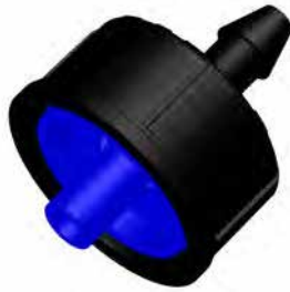
4 L/h PCND