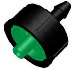
8 L/h PCND