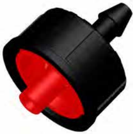
2 L/h PCND